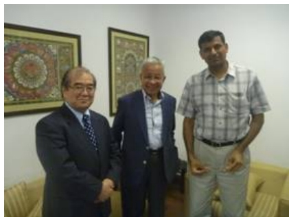
インド財務相チーフエコノミックアドバイザーのRaghuram Rajan氏 (RBI次期総裁)と同氏の執務室で会見: 「経常収支赤字の問題が一番の鍵。この安定化をまず行なう」