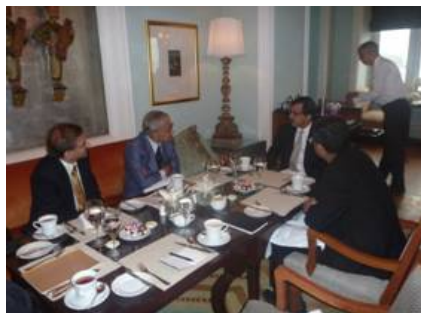
インド最大・最古の格付機関CRISILのトップマネジメントとの会合: 「今後5年間の成長率は6~7%を予想」(著名エコノミストJoshi氏)