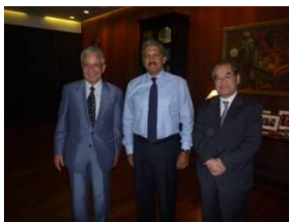
Mahindra & Mahindra会長兼CEO のAnand Mahindra氏と会見: 「インド経済回復のためには、強いリーダーシップを持った政権が必要」