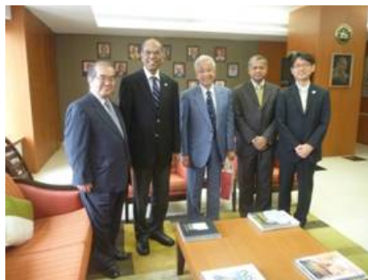
RBIスバラオ総裁と会見: インド、日本の経済状況と金融政策につき意見交換