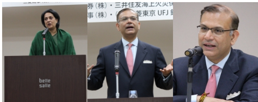
フドワ大使 来賓挨拶 内容はこちら(PDF)

㈱三菱東京UFJ銀行 Ernst & Young LLP ㈱インド経済フォーラム