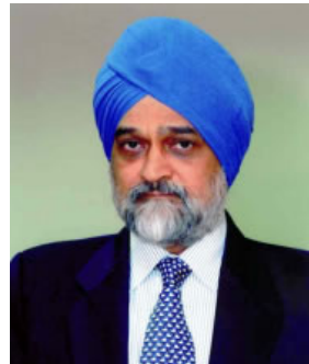
モンテック・アルワリア インド計画委員会副委員長