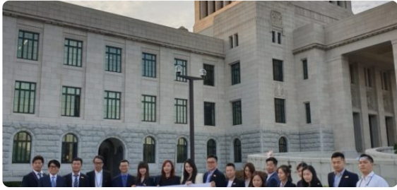
お知らせ / ニセコ不動産 / ルスツ不動産 / 北海道不動産 / 台湾事業進出 / 海外事業進出 / 留寿都不動産 / 紺野昌彦コラム / 経済ニュース / 香港事業進出 リレーチャイナ(Really China) 5 11月, 2019