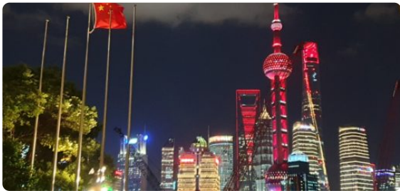
海外ツアー情報 / 紺野昌彦 / 紺野昌彦コラム / 紺野昌彦旅ブログ ユダヤマネーが支配した上海 18 10月, 2019